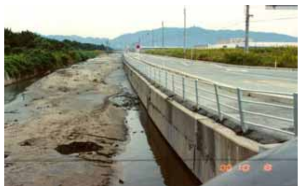
写真-2 路面の波打ち，水路の変状

よりN値換算する．土質は山陰臨海平野地盤図 4) に示される近隣のボーリング柱状図を参照した．その他，単位体積重量は文献 5) を参考とし，細粒分含有率は土質分類に対応させた代表値（中間値）とした．また，地表面の最大加速度はアンケート震度 6) をもとにして，震度(I)と最大加速度（）の関係式（河角の式） \log(\quad)=I/2-0.35 より得られる最大加速度を丸めて設定した．これら設定値を表-1に示す．