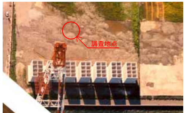
写真-1 竹内団地航空写真

竹内団地は弓ヶ浜半島の美保湾に面した人工埋立地で，昭和63年より埋め立てが開始された．地震により竹内団地内では広範囲にわたって液状化による噴砂が確認された．写真-1に対象地点の航空写真を示す．写真に示した地点では既往の標準貫入試験データがある．写真中に示した噴砂の拡がる地点でSW試験を行った．また，噴砂を採取して粒度試験を実施した．被害状況は噴砂・噴水のほか，路面の波打ち，水路の変状（写真-2参照）等の被害が見られた．