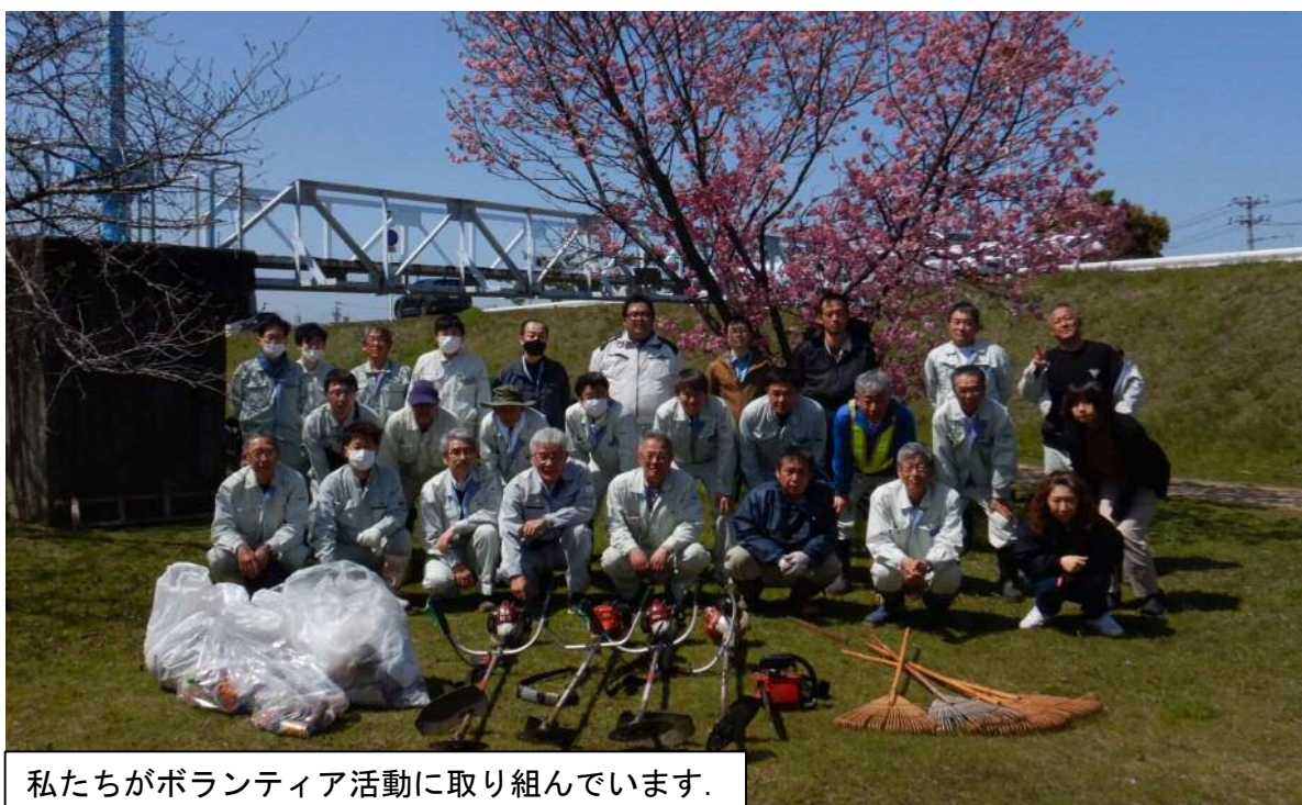
私たちがボランティア活動に取り組んでいます。