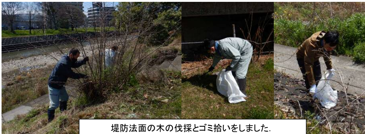
堤防法面の木の伐採とゴミ拾いをしました。